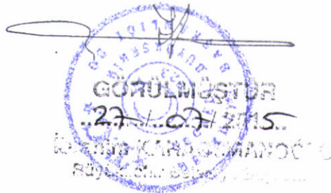
Özlem EKŞİ ŞAHİNKAYA Katip üye (2. Yedek)